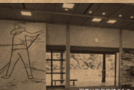
写真は昨年実績のもの