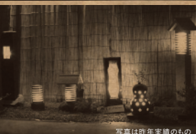
写真は昨年実績のもの